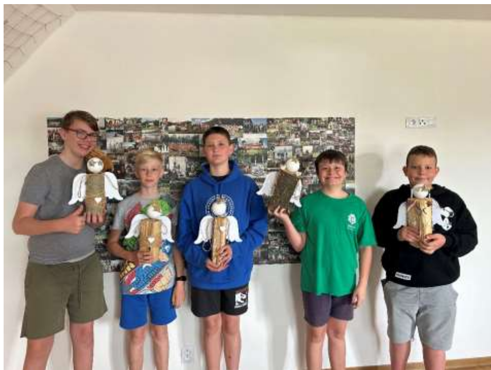
Diktovali skauti, zapsal Myškin

Celkový názor skautů na přespávačku byl 9/10